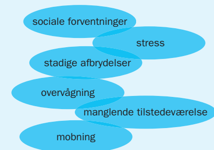
Figur 2: De nye medier, som bl.a. tæller mobiltelefonen, rummer muligheder for udvikling af nye kompetencer – men også risiko for faldgruber.

Kilde: Mandag Morgen på baggrund af Gitte Stald, Medierådet for Børn og Unge, 2007.