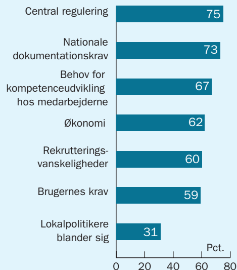
Figur: De kommunale chefer betragter den centrale regulering fra Christiansborg som den største hæmsko.

"Hvilke udviklinger i omgivelserne har betydning for dine ledelsesvilkår?"