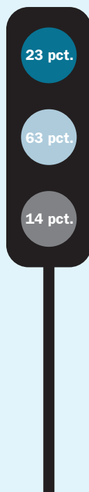
Figur 4: Kun knap hver fjerde medlem er meget loyal over for HK.

De har den laveste grad af loyalitet. De har mentalt forladt HK og vil derfor måske også omtale HK negativt over for nuværende såvel som potentielle medlemmer. Det er derfor problematisk, hvis HK har for mange af disse medlemmer.