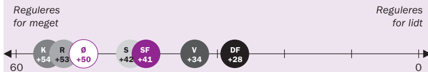
Figur 2: Et flertal i alle partiets vælgerkorps mener, at der reguleres for meget.

Procentforskel mellem vælgere, som mener, at der reguleres for meget minus vælgere, der mener, at der reguleres for lidt 1